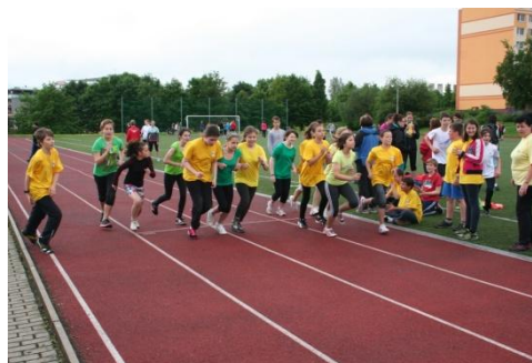
Sportovní den 2013/2014