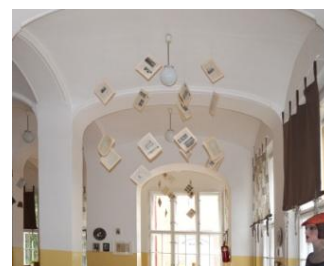
Literární kavárna na Klamovce