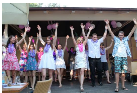
Mamma Mia na Zahradní slavnosti