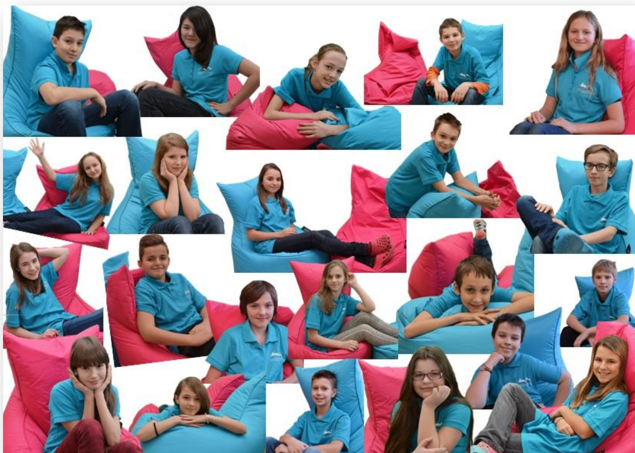
studenti 1. A, fotografie pro slovní hodnocení