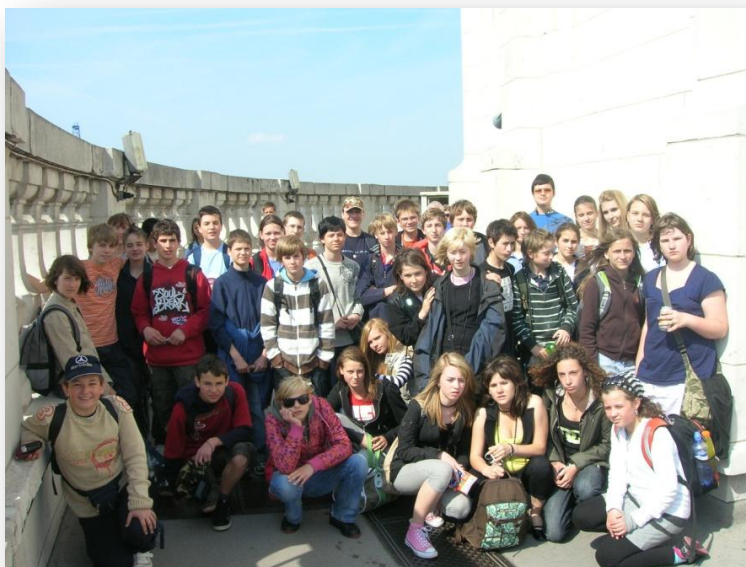
Poznávací zájezd do Anglie