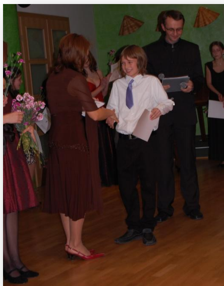
Imatrikulace prvních ročníků

V tomto školním roce se uskutečnily tři výjezdy do zahraničí. Prvním byl výměnný pobyt našich studentů se studenty v německém Markredwitzu, vzájemnými návštěvami jsme zahájili partnerství se školou ve francouzském Lyonu a do třetice jsme zorganizovali poznávací zájezd do Velké Británie. Konal se další karneval, lyžařský a poprvé environmentální kurz na Rýchorách. Před Vánocemi byli imatrikulováni naši současní maturanti, tedy studenti 8.A. Leden 2008 jsme si zpestřili novoročním basketbalovým turnajem. Týmy společně utvořili studenti, učitelé a rodiče. Na zahradní slavnosti se předvedli v tanečním vystoupení chlapci z tercie a sekundy, kdy na píseň Touha od Daniela Landy vyjádřili svá dětská přání a tužby.