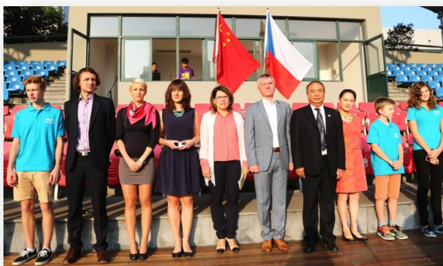
Z Hangzhou za výpravu Kou-Le Boss Li

Známem ostrově, z vody sledovali představení magické hrající fontány a rušný pobřežní život. K večeru jsme shlédli ze starověké pagody celé město, které je každý den schované pod závojem smogu. Jaká romantika! Protože nás čekala slavnostní večeře s představitelem města, v autobusu jsme přehodili ohoz a v 18h tak vstupovali do luxusního salonku úplně jiní lidé, než jací celý den obhlíželi městečko Hangzhou. Večeře byla na úrovni - skládala se z devíti chodů. A co víc! Moc jsme si i pochutnali. Večer utahaní jak psi uleháme do postýlek a těšíme se na další čínské zážitky a překvapení.